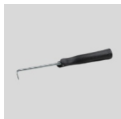
Obj.č. 7014 Zkušební háček