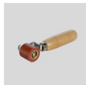
Obj.č. 6994 Přítlačný váleček 28 mm jednoramenný s ložisky