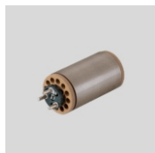
Obj.č. 3064 Topné tělísko 3000W / 230V