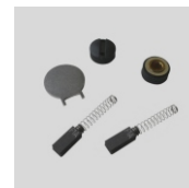
Obj.č. 9136 Náhradní uhlíky včetně klíče