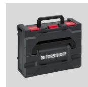
Obj.č. 7025 Přepřavní kufr systém metaBOX