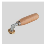
Obj.č. 6993 Přítlačný váleček konvexní 30 mm